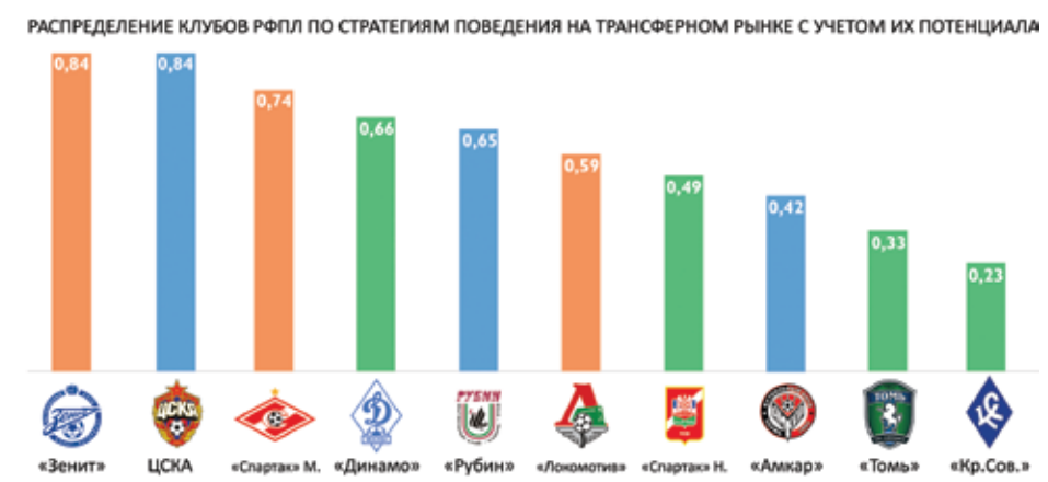
Таблица - 2. Распределение клубов РФПЛ по стратегиям поведения с учетом их потенциала.

В результате работы модуля анализа потенциалов было получено следующее распределение клубов РФПЛ по стратегиям (Таблица 2).