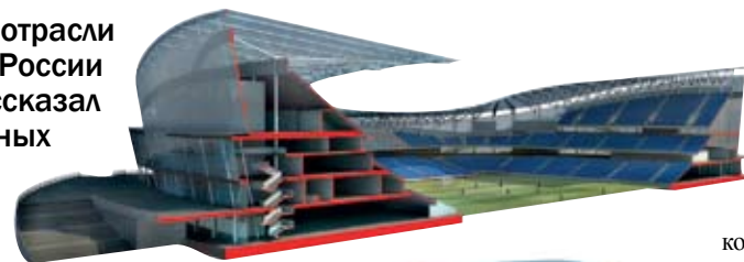
Стадион в Казани

Проектирование и эксплуатация - это вещи взаимосвязанные. Сегодня надо платить за новые технологии. И в большинстве случаев имеет смысл проектировать и строить более затратный объект, но затем экономить средства за счет применения новейших технологий. Не так давно один из крупнейших наших объектов прошел экспертизу. Это стадион «Зенит». Там общая сумма бюджета на строительство составляет порядка 30