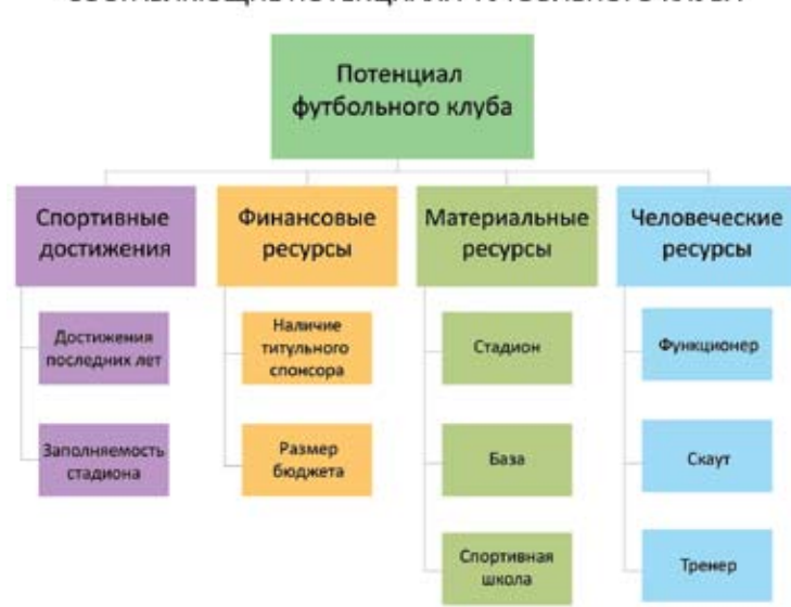
Рисунок 2. Составляющие потенциала футбольного клуба.

В результате работы модуля анализа потенциалов было получено следующее распределение клубов РФПЛ по стратегиям (Таблица 2).