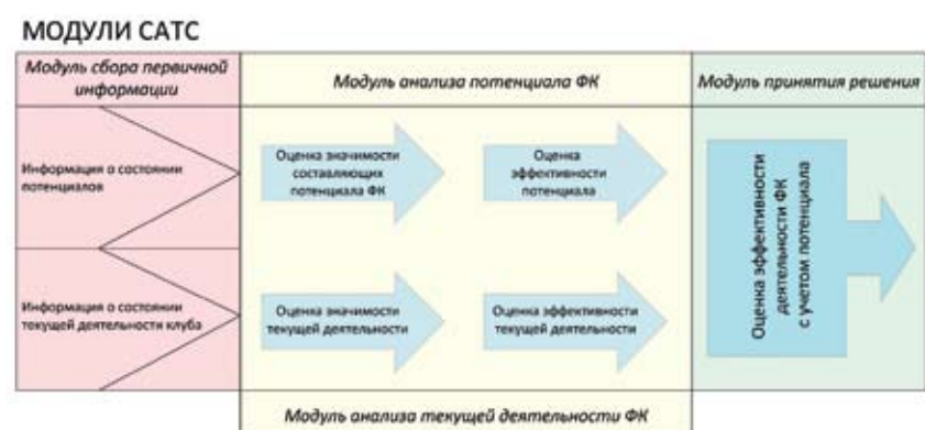
Рисунок 1. Модули САТС

В связи с тем, что все футбольные клубы отличаются друг от друга как по спортивным, так и по коммерческим возможностям, необходимо разработать доступную систему анализа трансферных стратегий, на основе которой любой футбольный клуб сможет оценить свою текущую трансферную политику и возможный потенциал, а также выбрать оптимальную стратегию поведения на трансферном рынке. Предлагаются следующая концепция системы анализа трансферных стратегий (САТС) (Рисунок 1).